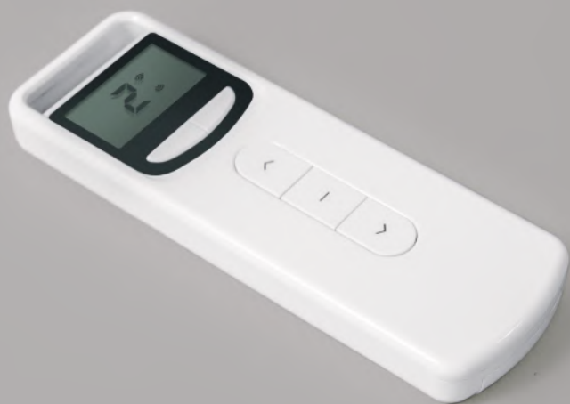
Pilot z wyświetlaczem VETRO 15-kanalowy, biały (VETRO_15R)

1. Sterowanie: możliwość sterowania 1 napędem bądź grupą do 20 napędów na każdym kanale