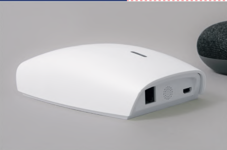
Dwukierunkowa centrala YOODA Smart Home 2 (YSH2_UNIT)